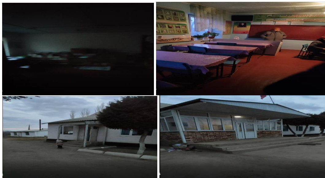
Рисунок 3. Фотографии объекта в с. Додон