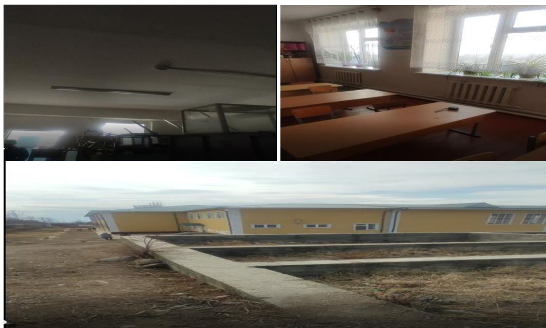
Рисунок 3. Фотографии объекта в с. Мазар-Суу