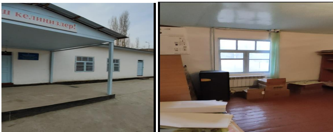
Рисунок 3. Фотографии объекта в с. Чон-Сай