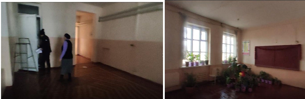
Рисунок 3. Фотографии объекта в с. Большевик