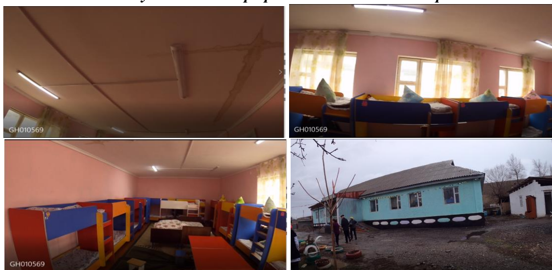
Рисунок 3. Фотографии объекта в с. Ак-Жар