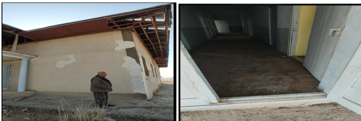
Рисунок 3. Фотографии объекта в с. Ала-Бука