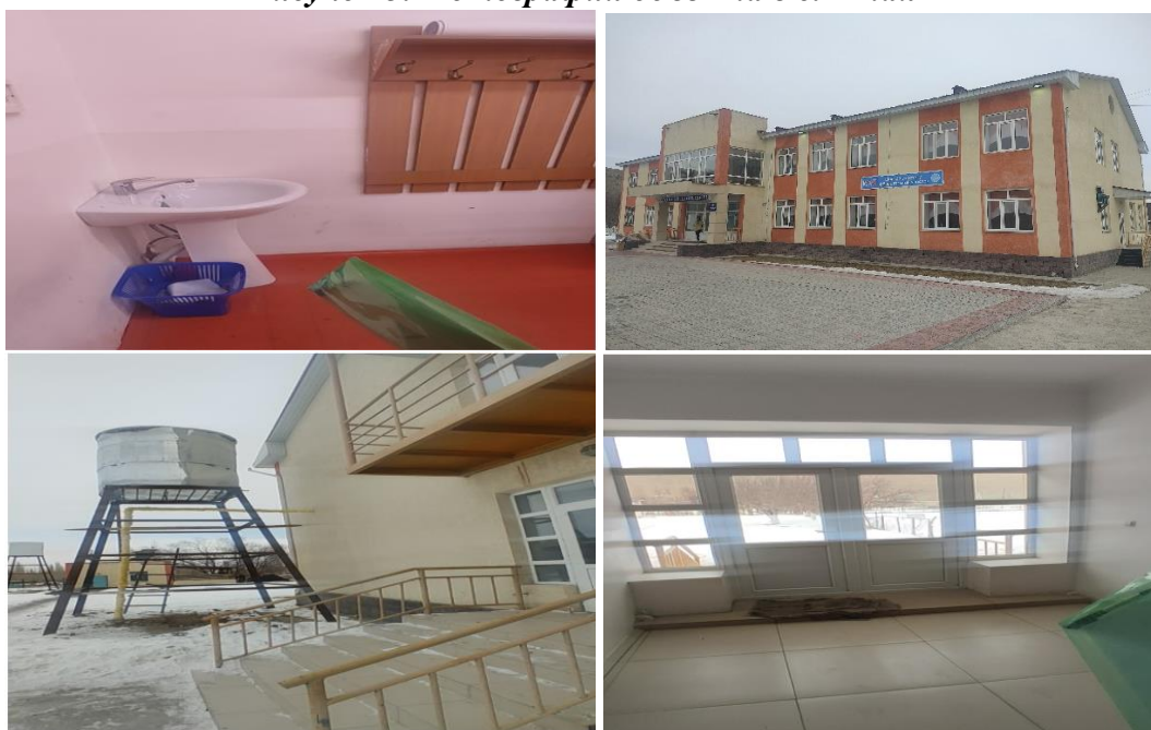
Рисунок 3. Фотографии объекта в с. Атай