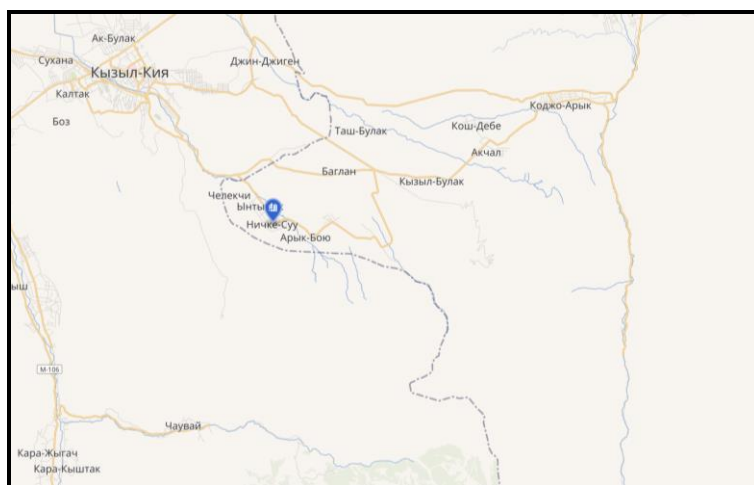
Рисунок 2. Место расположение объекта

На территории Ынтымакского айыльного округа. В селе Ынтымак расположен детский сад, который в данное время функционирует и находится в удовлетворительном состоянии. Для создания ОДС кратковременного пребывания в вышеуказанном здании выделяются отдельно комнаты, в которых требуется провести ремонтно-восстановительные работы.