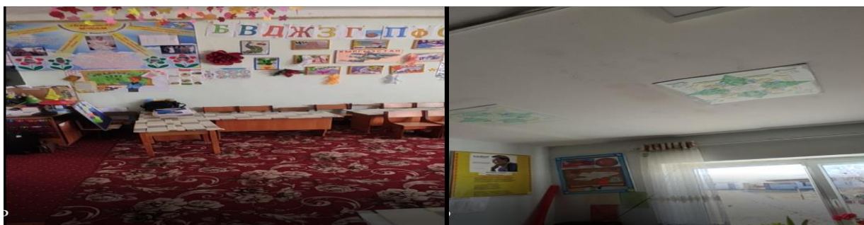
Рисунок 3. Фотографии объекта в с. Интымак