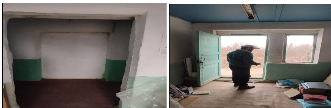
Рисунок 3. Фотографии объекта в с. Кош-Болот