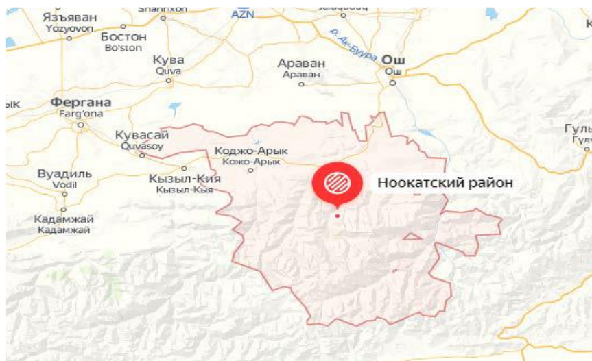
Рисунок 1. Местоположение района