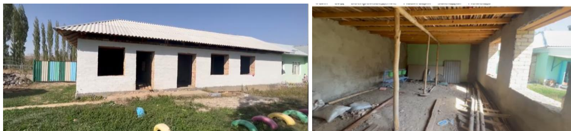
Рисунок 3. Фотографии детского сада в с. Кенеш