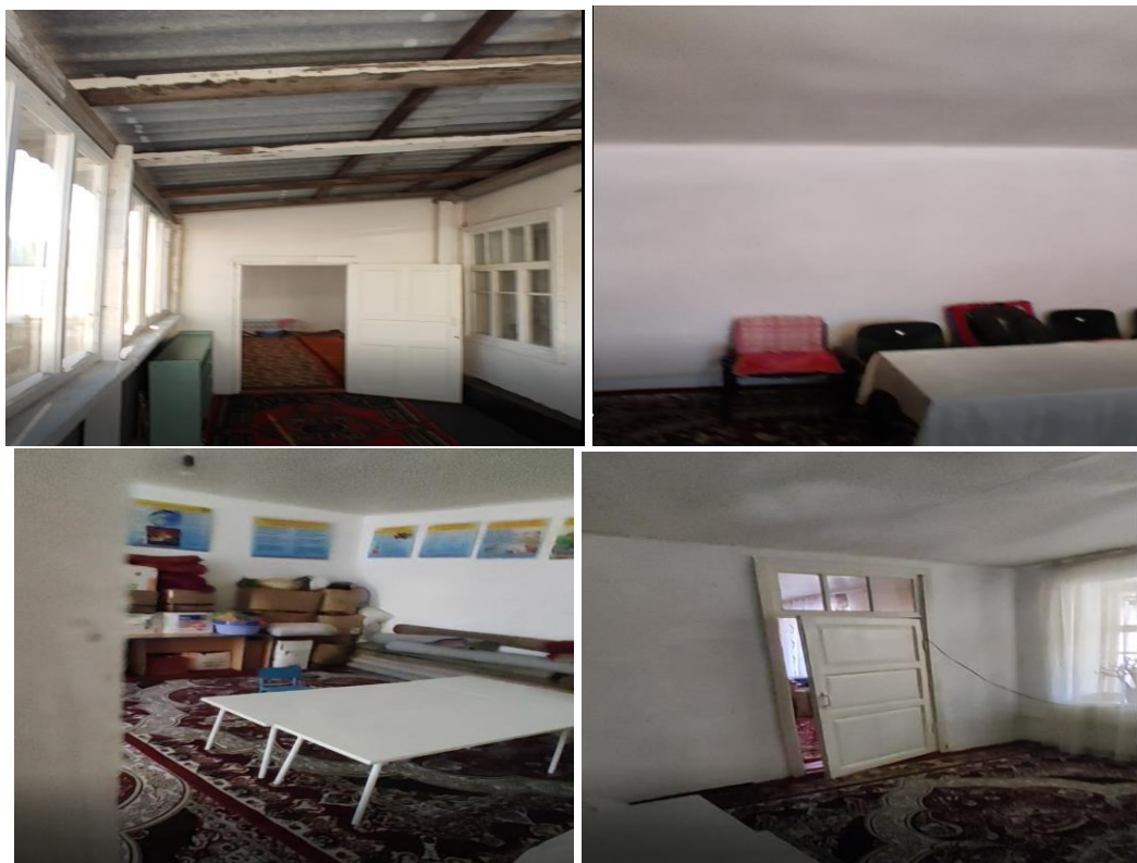
Рисунок 3. Фотографии объекта в с. Согонду