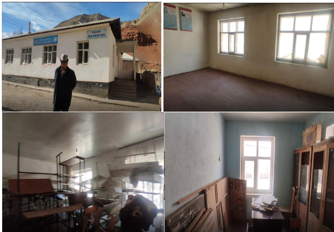
Рисунок 3. Фотографии объекта в с. Коджо-Келен