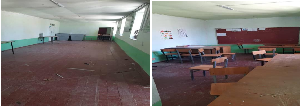
Рисунок 3. Фотографии объекта в с. Жаны Арык