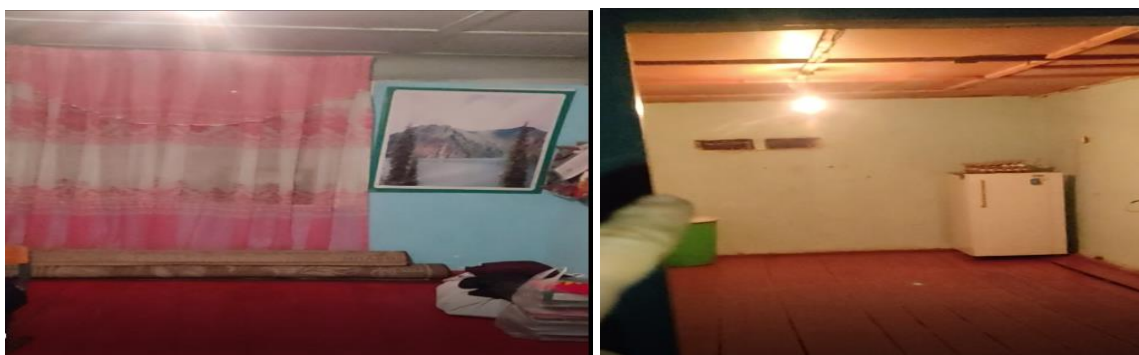
Рисунок 3. Фотографии объекта в с. Толман