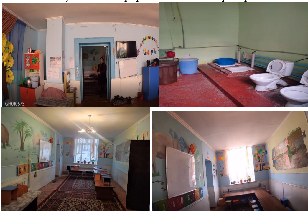
Рисунок 3. Фотографии объекта в с. Мырза-Арык