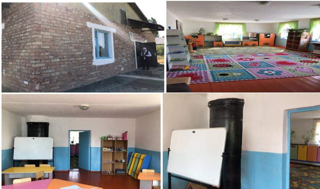
Рисунок 3. Фотографии детского сада в с. Уч-Булак