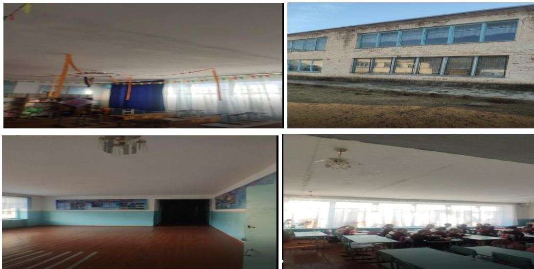
Рисунок 3. Фотографии объекта в с. Ак-Тектир