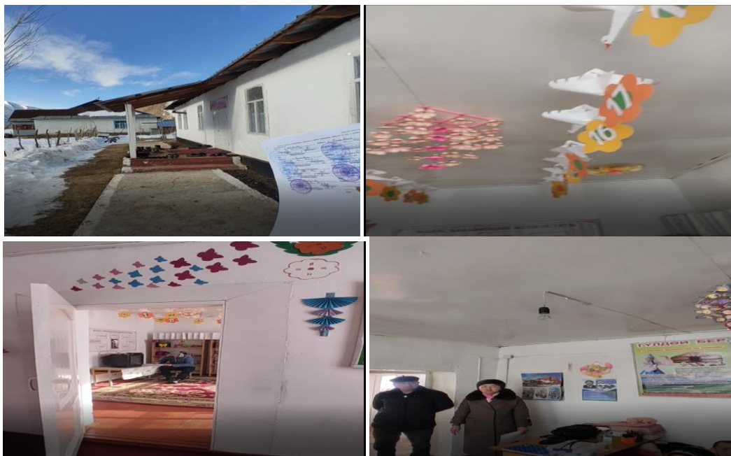
Рисунок 3. Фотографии объекта в с. Кондук