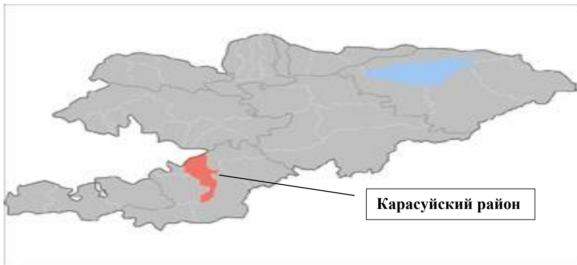
Рисунок 1. Местоположение района