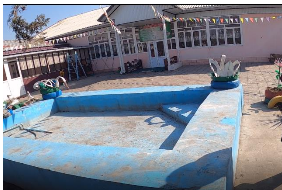
Рисунок 3. Фотографии объекта в с. Таджикабад