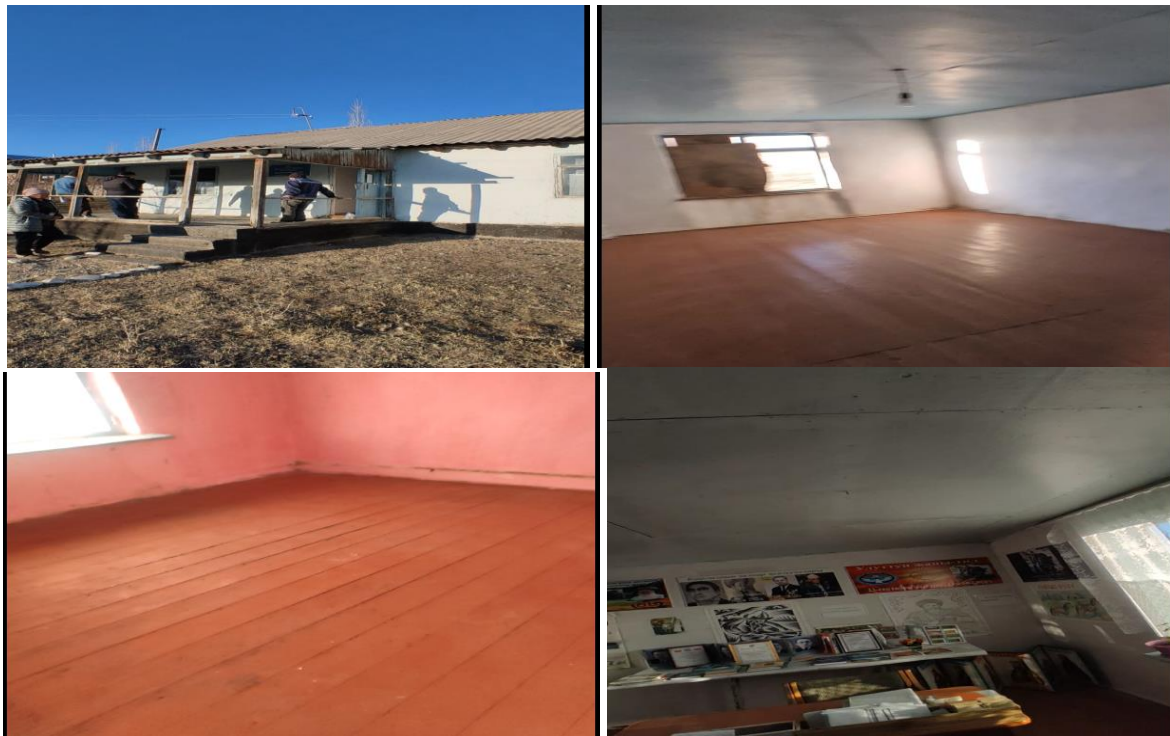
Рисунок 3. Фотографии объекта в с. Кара-Тобо