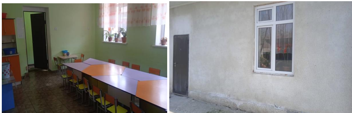
Рисунок 3. Фотографии объекта в с. Мангыт