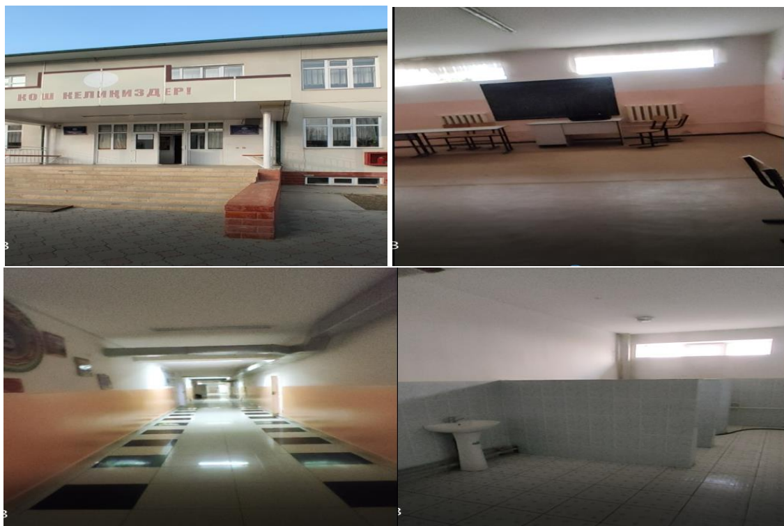
Рисунок 3. Фотографии объекта в с. Толойкен