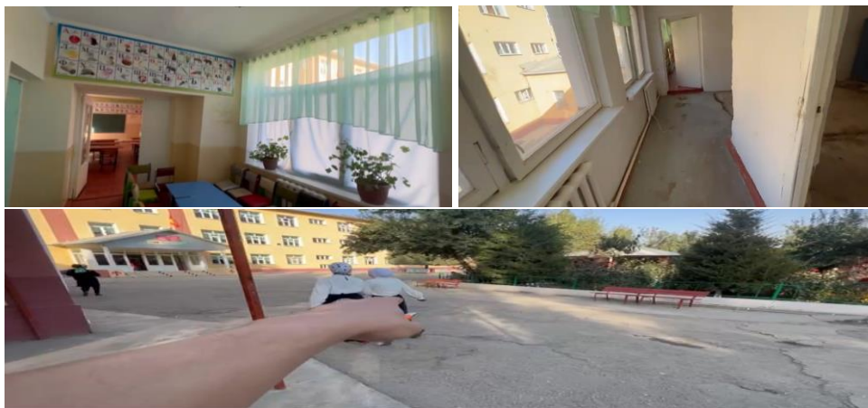
Рисунок 3. Фотографии детского сада в с. Темир-Коорук