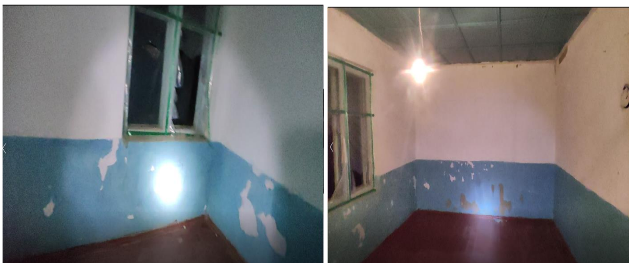
Рисунок 3. Фотографии объекта в с. Топ Терек