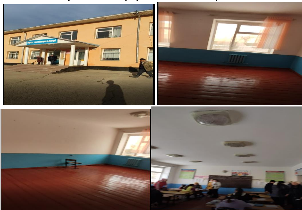
Рисунок 3. Фотографии объекта в с. Корс-Этти