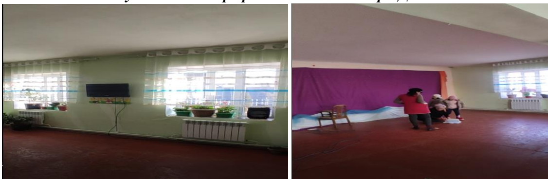
Рисунок 3. Фотографии объекта в с. Кара-Дыйкан