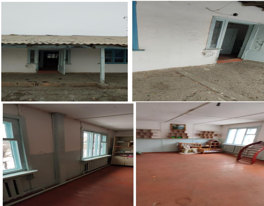
Рисунок 3. Фотографии объекта в с. Казарман