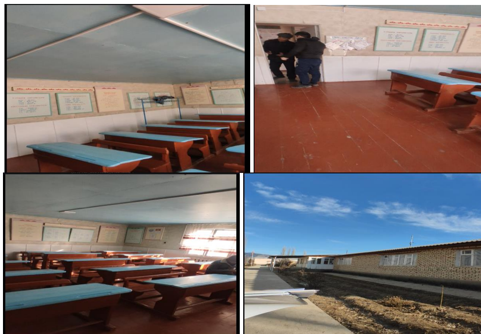
Рисунок 3. Фотографии объекта в с. Сыны