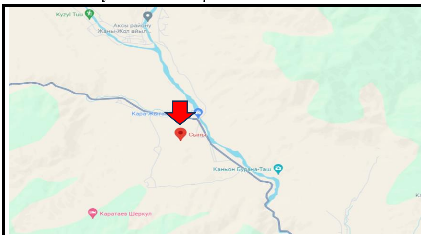
Рисунок 2. Место расположение объекта