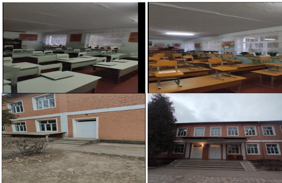
Рисунок 3. Фотографии объекта в с. Кум