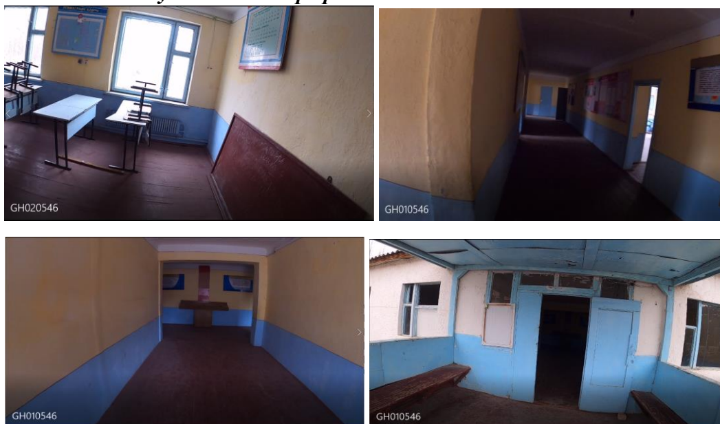
Рисунок 3. Фотографии объекта в с. Жаны-Айыл