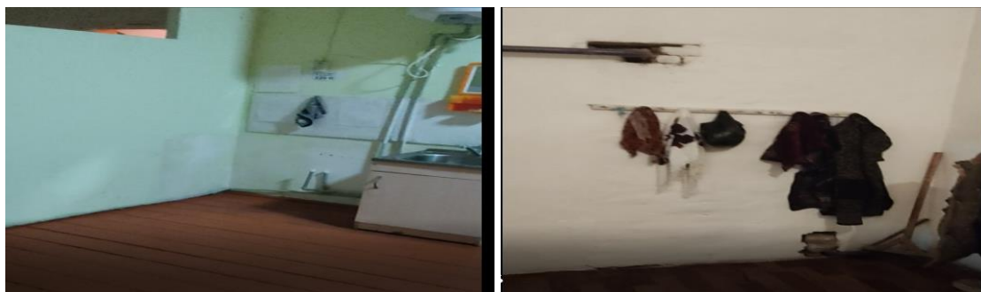
Рисунок 3. Фотографии объекта в с. Герейн-Шоро