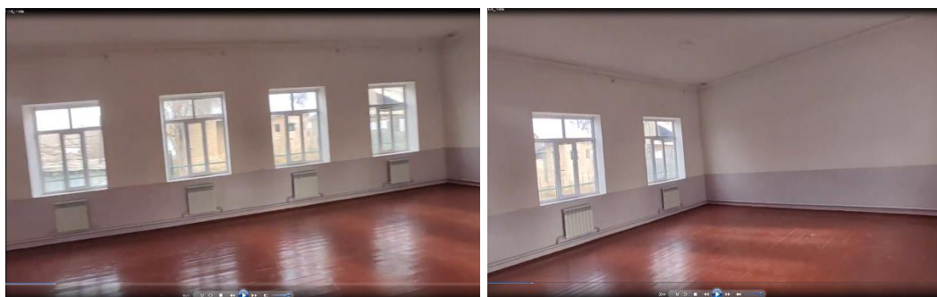
Рисунок 3. Фотографии объекта в с. Чангыр-Таш