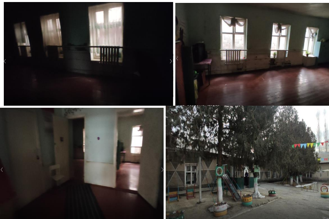
Рисунок 3. Фотографии объекта в с. Айбек