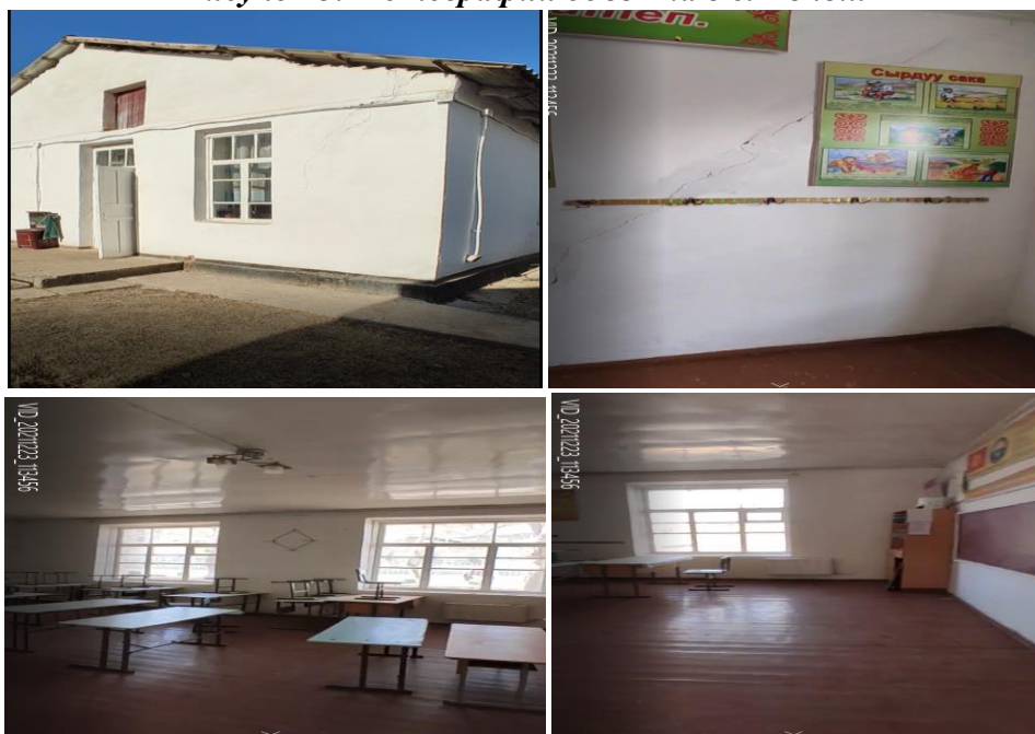
Рисунок 3. Фотографии объекта в с. Кенеш