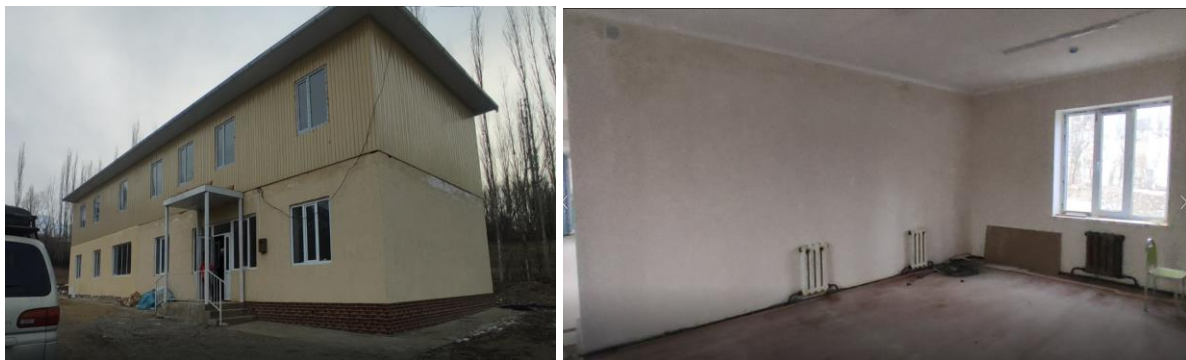
Рисунок 3. Фотографии объекта в с. Дары-Булак