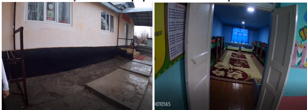
Рисунок 3. Фотографии объекта в с. Жээренчи