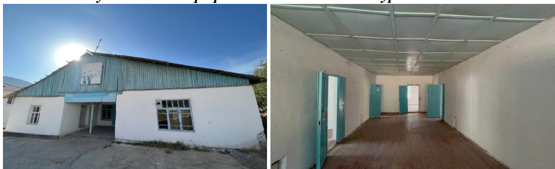
Рисунок 3. Фотографии детского сада в с. Чурбек