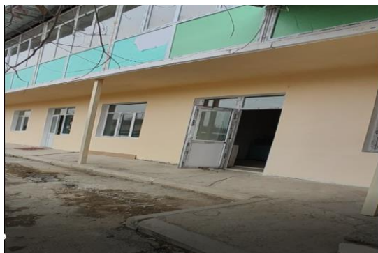
Рисунок 3. Фотографии объекта в с. Найман