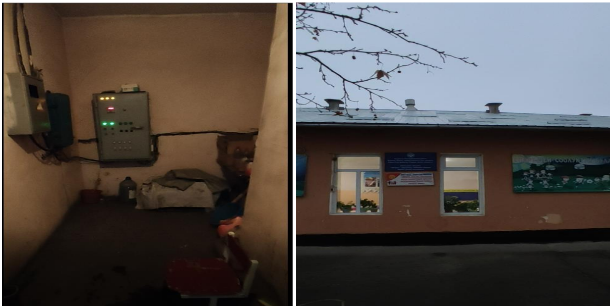
Рисунок 3. Фотографии объекта в с. Ынтымак