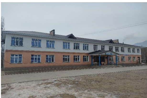
Рисунок 3. Фотографии объекта в с. Кара-Суу