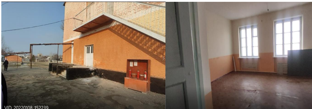
Рисунок 3. Фотографии объекта в с. Большевик