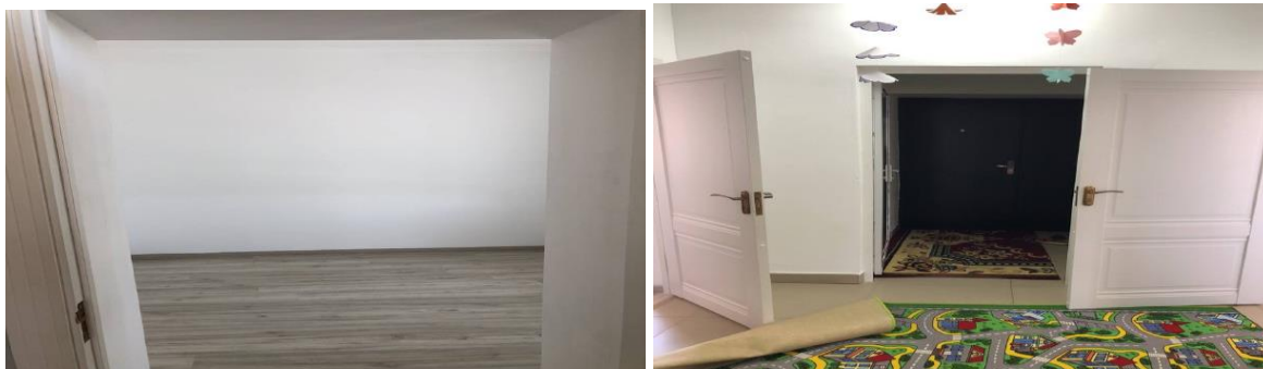
Рисунок 3. Фотографии детского сада в с. Куру-Маймак