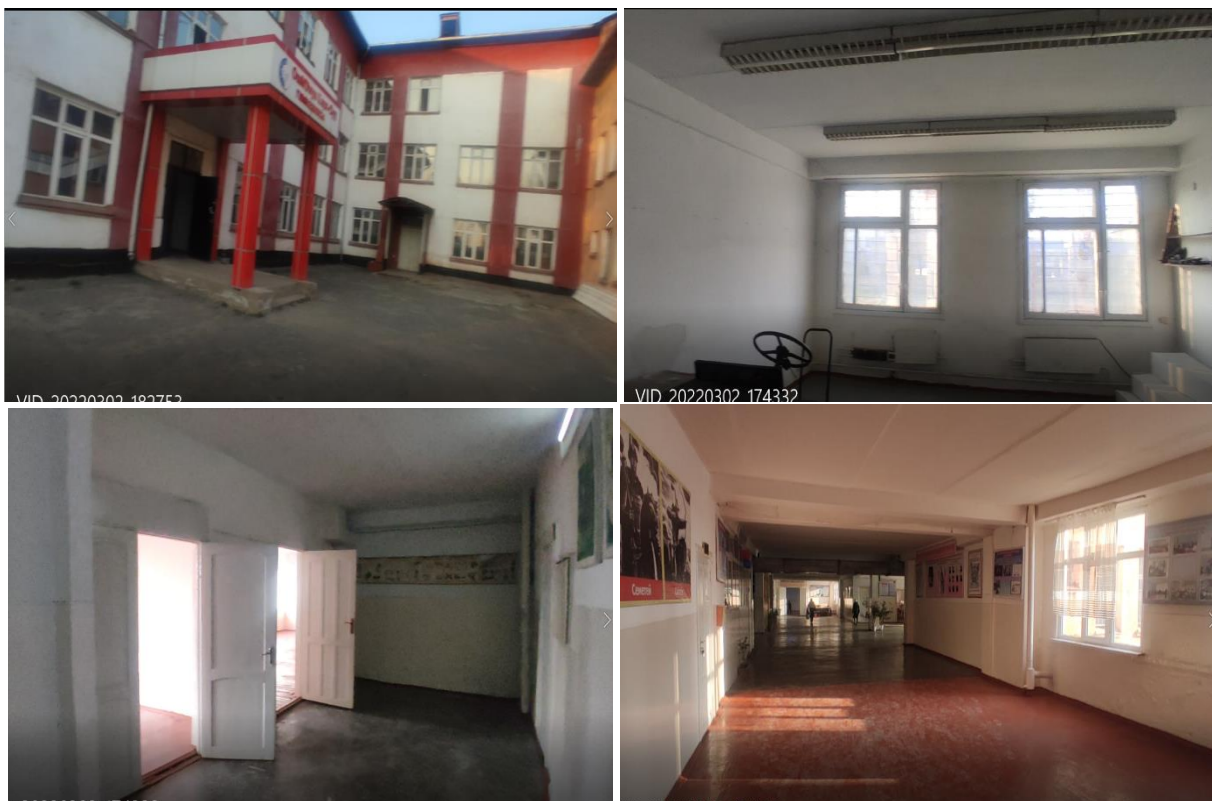
Рисунок 3. Фотографии объекта в г. Кара-Суу