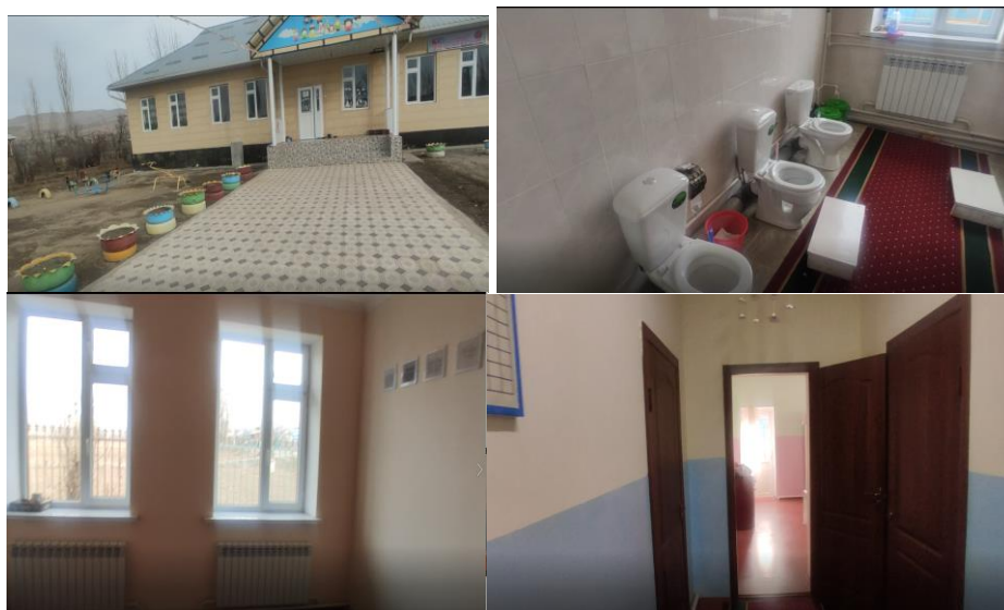
Рисунок 3. Фотографии объекта в с. Байыш