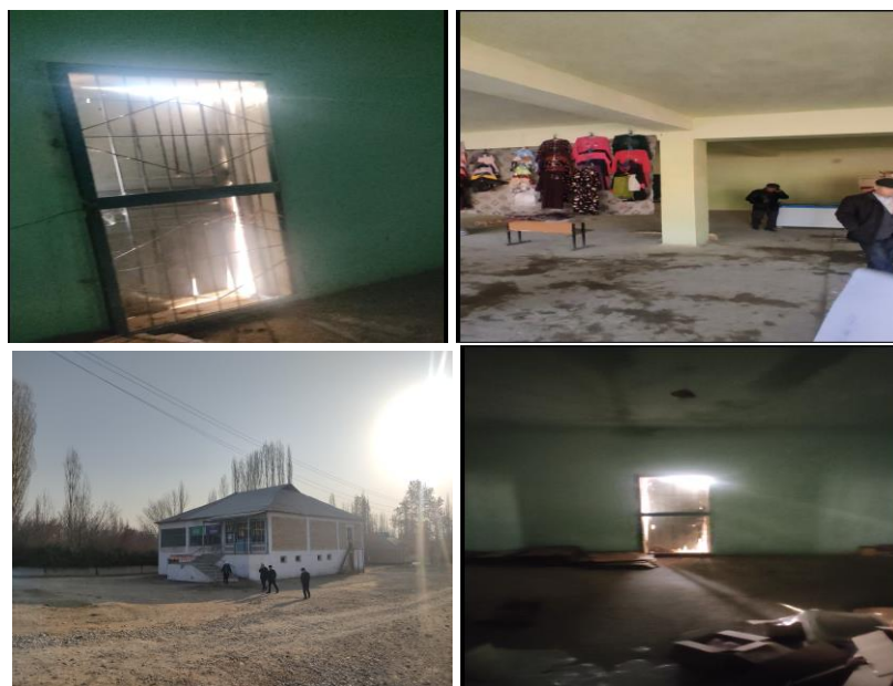
Рисунок 3. Фотографии объекта в с. Кашкалак