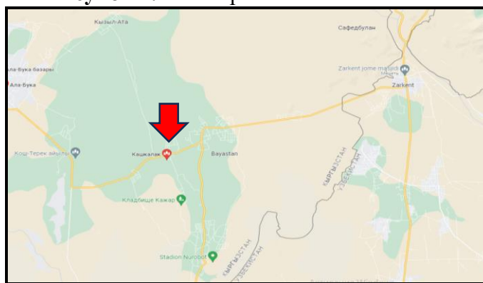
Рисунок 2. Место расположение объекта