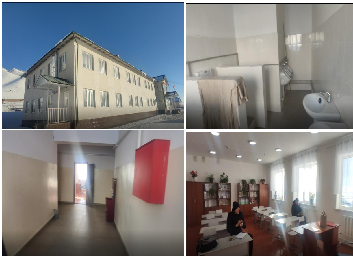
Рисунок 3. Фотографии объекта в с. Кулчу