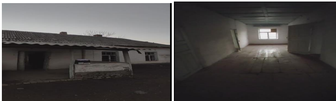
Рисунок 3. Фотографии объекта в с. Барны