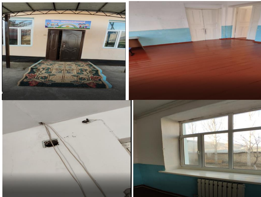
Рисунок 3. Фотографии объекта в с. Сай