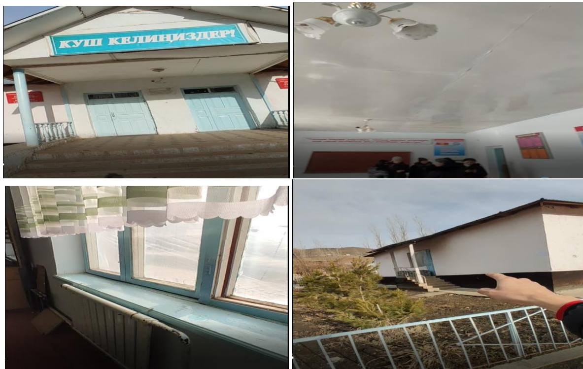
Рисунок 3. Фотографии объекта в с. Жангакты