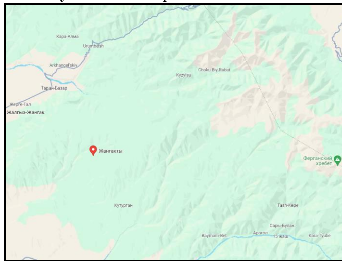
Рисунок 2. Место расположение объекта

создания ОДС кратковременного пребывания в вышеуказанном здании выделяются отдельно комнаты, в которых требуется провести ремонтно-восстановительные работы.