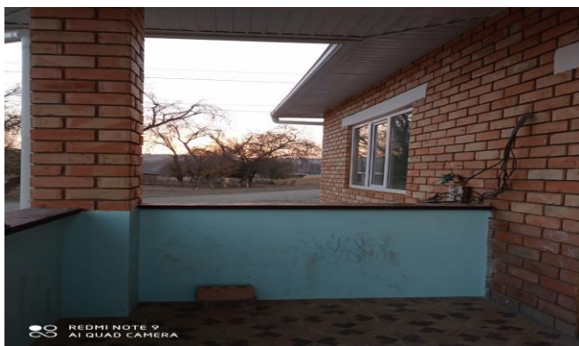
Рисунок 3. Фотографии объекта в с. Найман